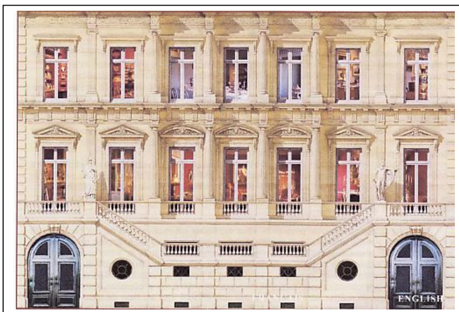
Façade de l'Hôtel Collot

Mais comme rien n'arrête les membres du club Accél'Air, nous étions nombreux pour découvrir cette superbe exposition dans ce magnifique Hôtel Particulier qu'est l'Hôtel Collot.